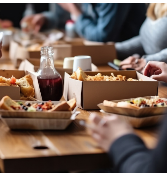
Fast casual dining